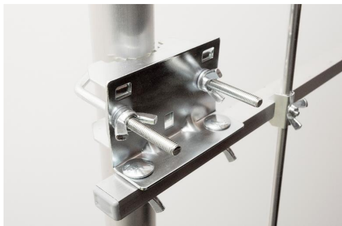
Uchwyt polaryzacja pionowa