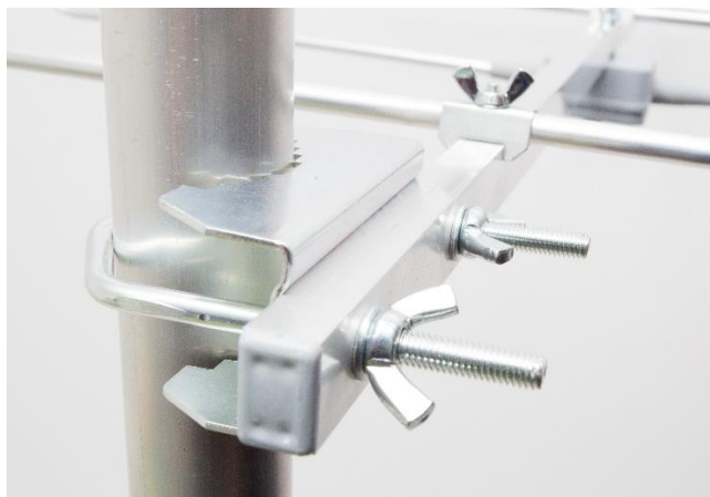
Uchwyt polaryzacja pozioma